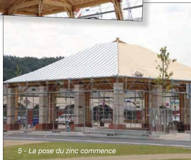
5 - La pose du zinc commence