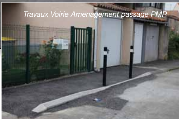
Travaux Voirie Aménagement passage PMR