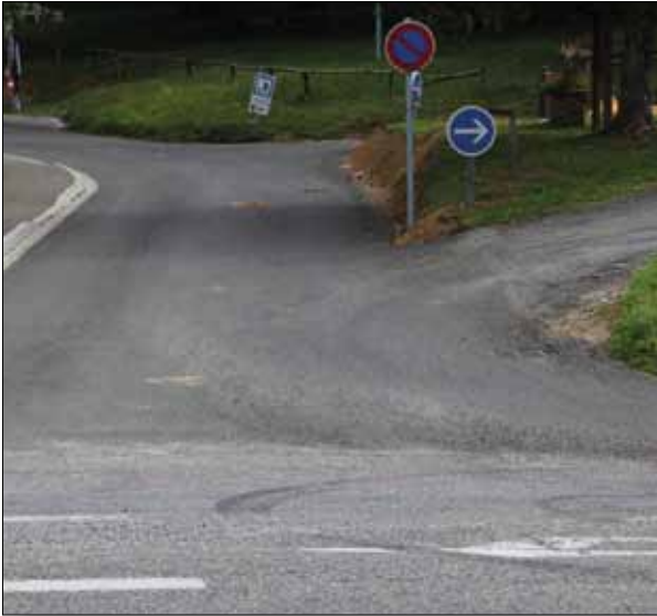
Travaux Voirie Avenue du Pic du Midi depuis RD 817