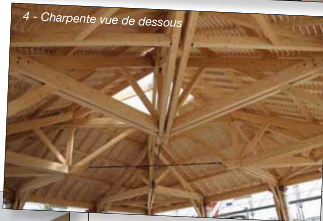
4 - Charpente vue de dessous