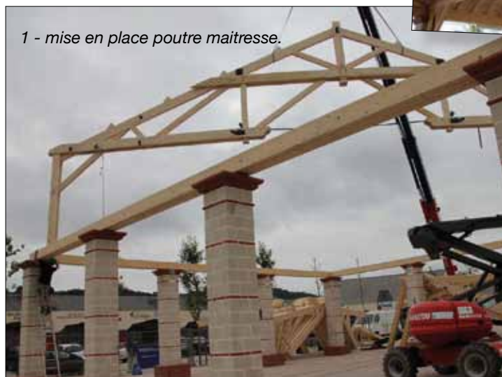
1 - mise en place poutre maitresse.