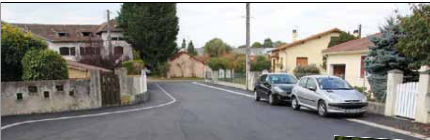
Impasse des Garennes depuis le fond