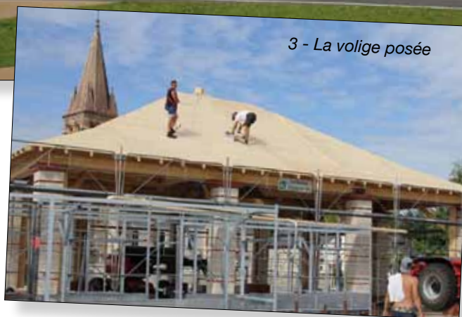
3 - La volige posée