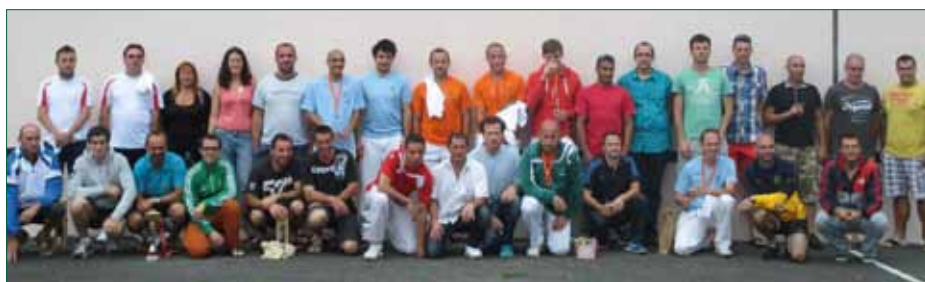
Une partie des joueurs qui ont participé à ce 1er Open des Pyrénées