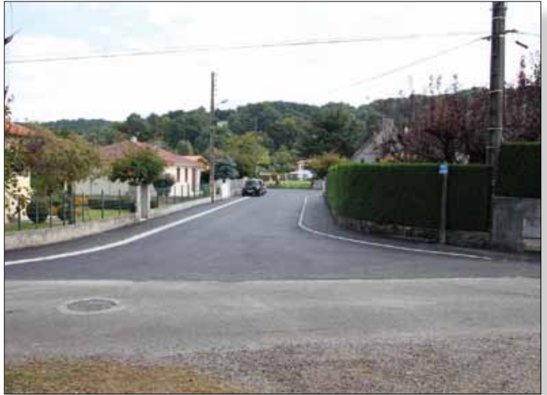
Refecton Impasse des Garennes